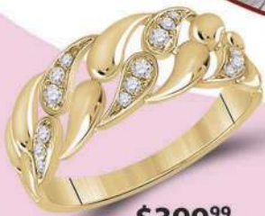
$399 99 153372 14kt 1/6 ctw