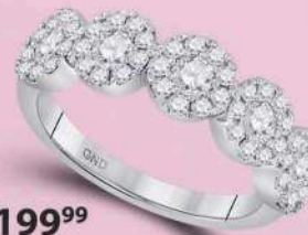
$1199 99 150866 14kt 1 ctw