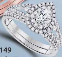
154149 14kt 1 ctw