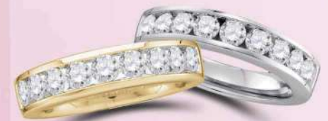
YELLOW WHITE 1/6 ctw 96691 96692 14kt $359 99 1/4 ctw 14476 13980 14kt $399 99 1/2 ctw 14191 13981 14kt $799 99 1 ctw 14197 13918 14kt $1749 99