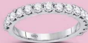
1/4 ctw 92243 14kt $319 99 1/2 ctw 92245 14kt $549 99 1 ctw 92247 14kt $999 99