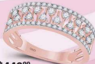
$449 99 153045 14kt 3/8 ctw