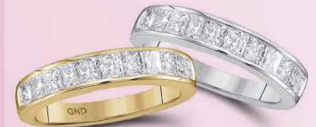
YELLOW WHITE 1/4 ctw 11075 11076 14kt $479 99 1/2 ctw 11077 11078 14kt $699 99 1 ctw 9947 8898 14kt $1599 99