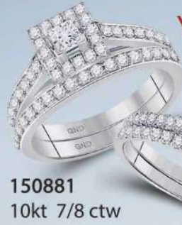
150881 10kt 7/8 ctw