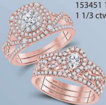
$1999 99 153451 14kt 1 1/3 ctw